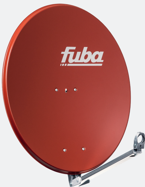
DAL 800 R, Art.-Nr. 11003014