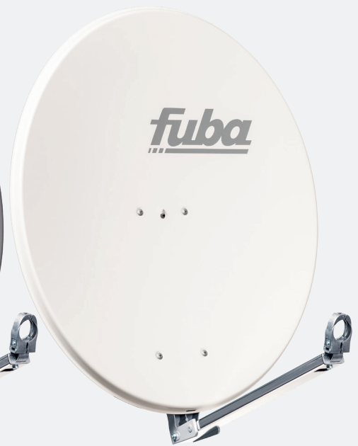
DAL 800 W, Art.-Nr. 11003015