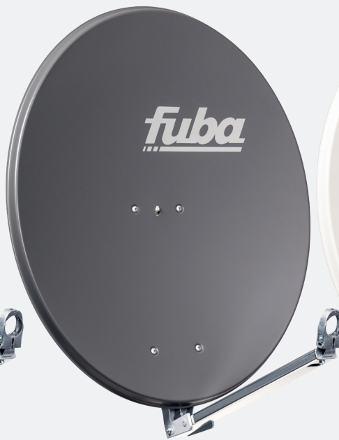
DAL 800 A, Art.-Nr. 11003011