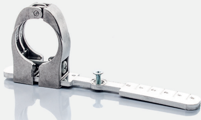
DAZ 102, Art.-Nr. 57615048

Mit folgendem, optional erhältlichem Zubehör lässt sich die Antenne in wenigen Schritten in eine Mehrsatellitenanlage wandeln.