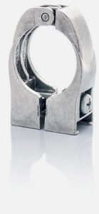
DAZ 740, Art.-Nr. 57615057