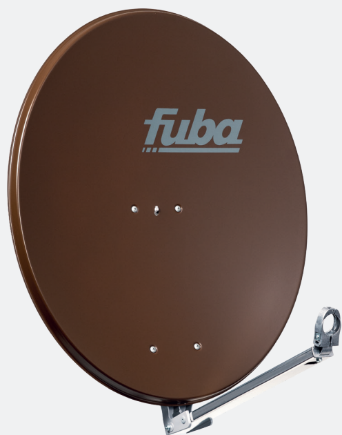
DAL 800 B, Art.-Nr. 11003012