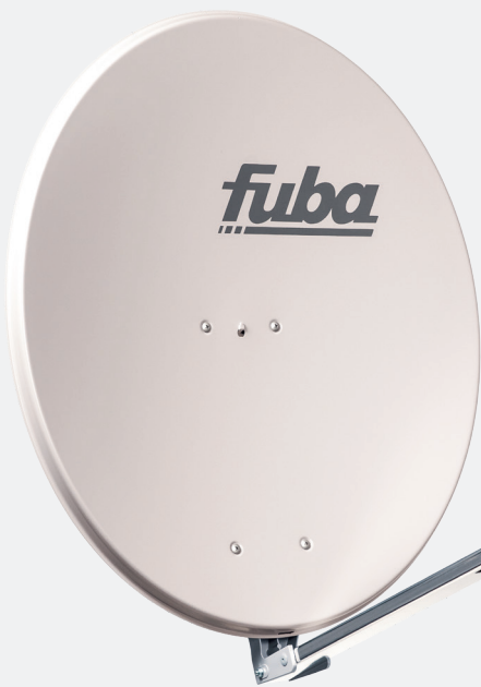
DAL 800 G, Art.-Nr. 11003013