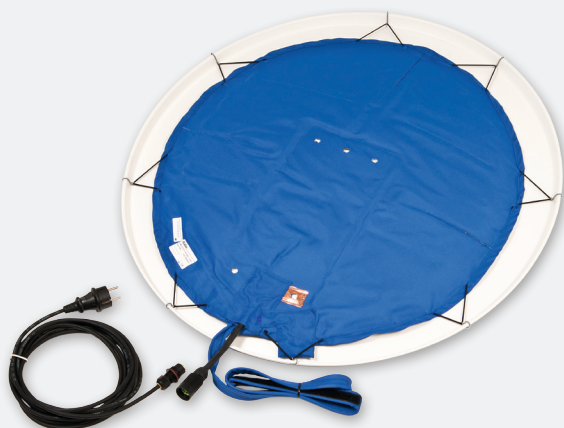
AHZ 780, Art.-Nr. 20090001

Sie verfügt über einen integrierten Thermo- sensor zur automatischen Ein- bzw. Abschalt- ung. Ganz einfach rückseitig am Antennenre- flektor angebracht, beseitigt sie Vereisungen