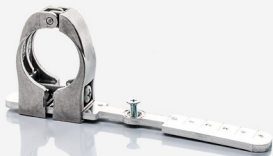
DAZ 102, Art.-Nr. 57615048